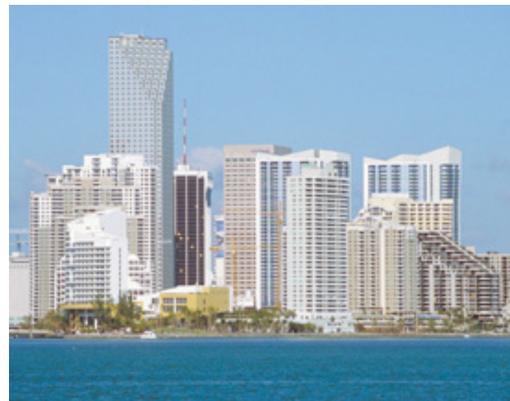
Segundo a pesquisa, 1 em cada 10 brasileiros que compram imóvel em Miami vem do Nordeste. Dentre os compradores nordestinos, 40% são do Ceará