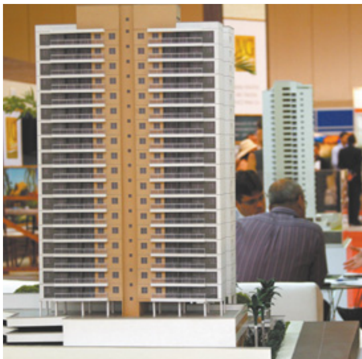
Os consórcios seguem na contramão do atual cenário financeiro do Brasil e são crescentes em todas as regiões do País

Além de ter um custo mais acessível do que os de financiamentos de imóveis, o consórcio tem suas vendas amplificadas, segundo Pinto, à crescente consciência dos compradores. “O consumidor hoje não vê só a parcela, ele